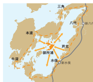
乗合い海上タクシーサービス提供エリアのイメージ