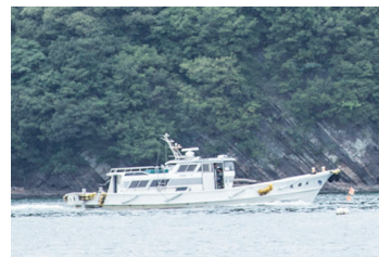
海上タクシー 乗合い海上タクシーサービス提供エリアのイメージ

主催 うみらくプロジェクト/NPO法人イーモビネット 助成 一般財団法人トヨタ・モビリティ基金