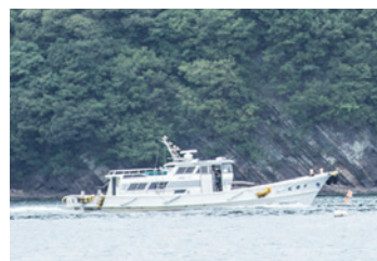
海上タクシー 乗合い海上タクシーサービス提供エリアのイメージ

不知火海は、橋でつながっていない島々が点在するエリア。島々と九州本土をつなぐ、島民や観光客といった人々の往来のための定期船がいくつもの航路で運航しています。ただ定期船航路は、便数や運航時間が限られているので、朝夕の時間帯などにチャーターできる小型船舶「海上タクシー」も、重要な海の交通手段のひとつとなっています。私たちは、海の交通を、テクノロジーを用いてもっと便利に、もっと使いやすくするべく、2019年5月に「うみらくプロジェクト」を立ち上げました。 主催 うみらくプロジェクト/NPO法人イーモビネット 助成 一般財団法人トヨタ・モビリティ基金